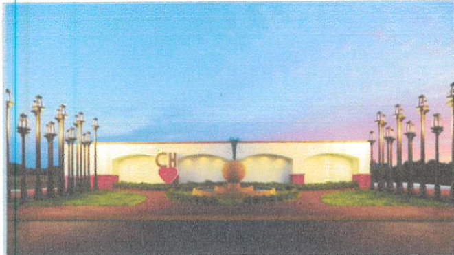
ESPACIOS PÚBLICOS/ DE USO COMÚN