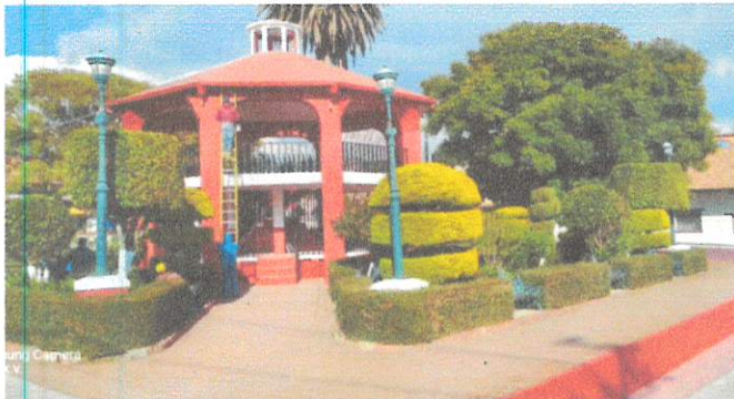
PARQUES Y JARDINES